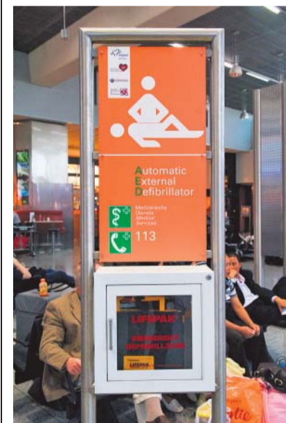
Tür auf, Koffer raus.