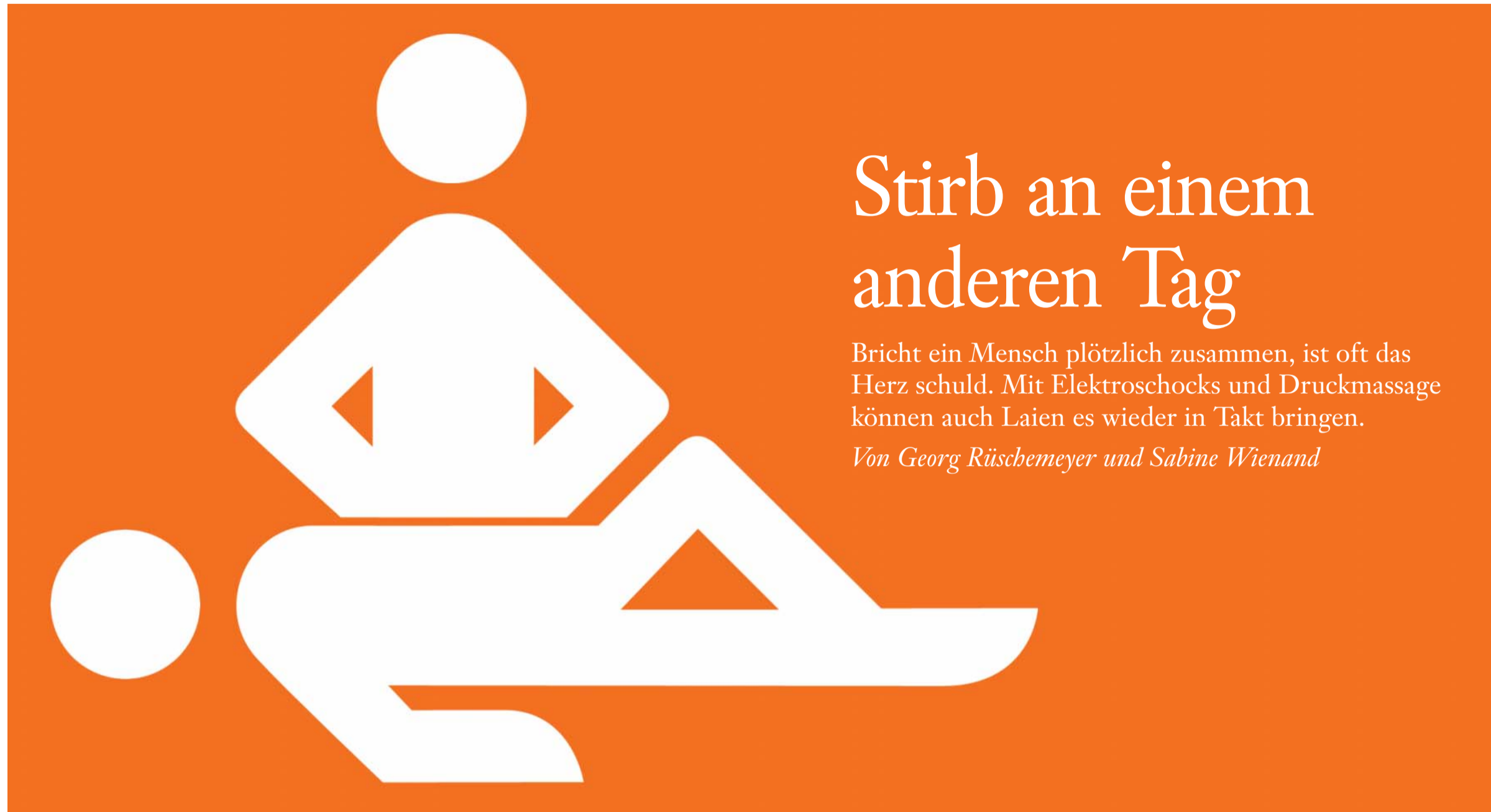
Das Herzmassagepiktogramm macht klar: Die kleine schwarze Tasche, die hier hängt, ist kein Erste-Hilfe-Koffer, sondern ein Elektroschockgerät.

Von Georg Rüschemeyer und Sabine Wienand