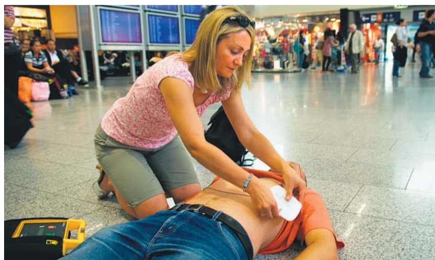
Hemd hoch, Elektroden drauf, Defi ein, Schritt zurück: Dann übernimmt das Gerät.

Die Folge: Das Gehirn wird nicht mehr mit Sauerstoff versorgt, und das Opfer verliert innerhalb von Sekunden das Bewusstsein.